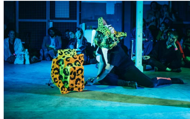
Ci-contre Tremendo Parche Latino (cd Valentine Zeller)